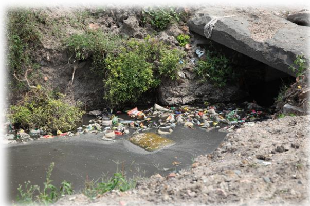
A Halligudi, la gestion des déchets est un véritable problème de santé publique.