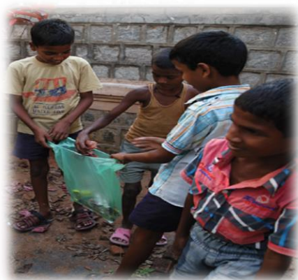
Journée de l'environnement organisée au sein du village.

Après des mères et des enfants, la nursery souhaite apporter un soutien préventif et éducatif notamment via la mise en place de bonnes pratiques en matière d'hygiène ainsi que d'éveil de l'enfant sur son environnement proche.