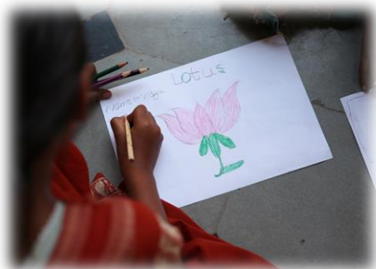
Des enfants de l'école d'Halligudi dessinant une fleur de Lotus, symbole en Inde de l'épanouissement des consciences.

La mise en place de projets participatifs dans un tel espace de rencontre permet donc d'impacter à petite échelle sur l'environnement et d'améliorer le bien-être de tous, petits et grands.